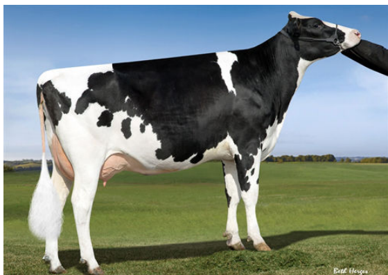
SAR-JAS UNO SIDRA